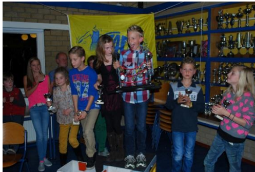
Rode Draad feest