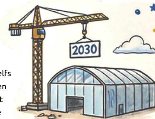
Indoorhal in 2030 Geplande realisatie van een multifunctionele indoor atletiekhal op het Arenapark om het hele jaar door kwalitatief te kunnen trainen.

De gemeente Hilversum heeft ambitieuze plannen tot herontwikkeling van de gehele zone Arenapark. Deel van de plannen is het realiseren van een zeer ruime sporthal, waar zowel onderwijs als de lokale sportclubs terecht kunnen. GAC heeft als partner in de ontwikkeling van de plannen een bijdrage geleverd, wat ertoe heeft geleid dat een indoor atletiekhal in het uitvoeringsprogramma is opgenomen. De hal zal moeten verrijzen op de plek waar nu nog parkeerplaatsen zijn, op een steenworp afstand van de baan. Het verwachte moment van realisatie is 2030. In de tussentijd worden de plannen verder uitgewerkt, met bijzondere aandacht voor de wijze waarop de partners samen de exploitatie vormgeven. Uitgangspunt is hierbij voor GAC dat financiële risico's gemeden worden, zodat de continuïteit van de club op geen wijze in gevaar komt. Vanuit de ambitie om in 2032 een flinke groei in indooratletiek hallen te hebben gerealiseerd, ondersteunt de Atletiekunie het initiatief van harte.